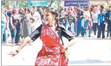
ਏਕਲ ਨੁਲ ਕੀ ਪ੍ਰਸਤੁਤਿ ਦੇਵੀ ਸਟੂਡੈਂਟ, (ਦਾਏਂ) ਸਮੂਹ ਨੁਲ ਕਰਨੀ ਸਟੂਡੈਂਟਸ।