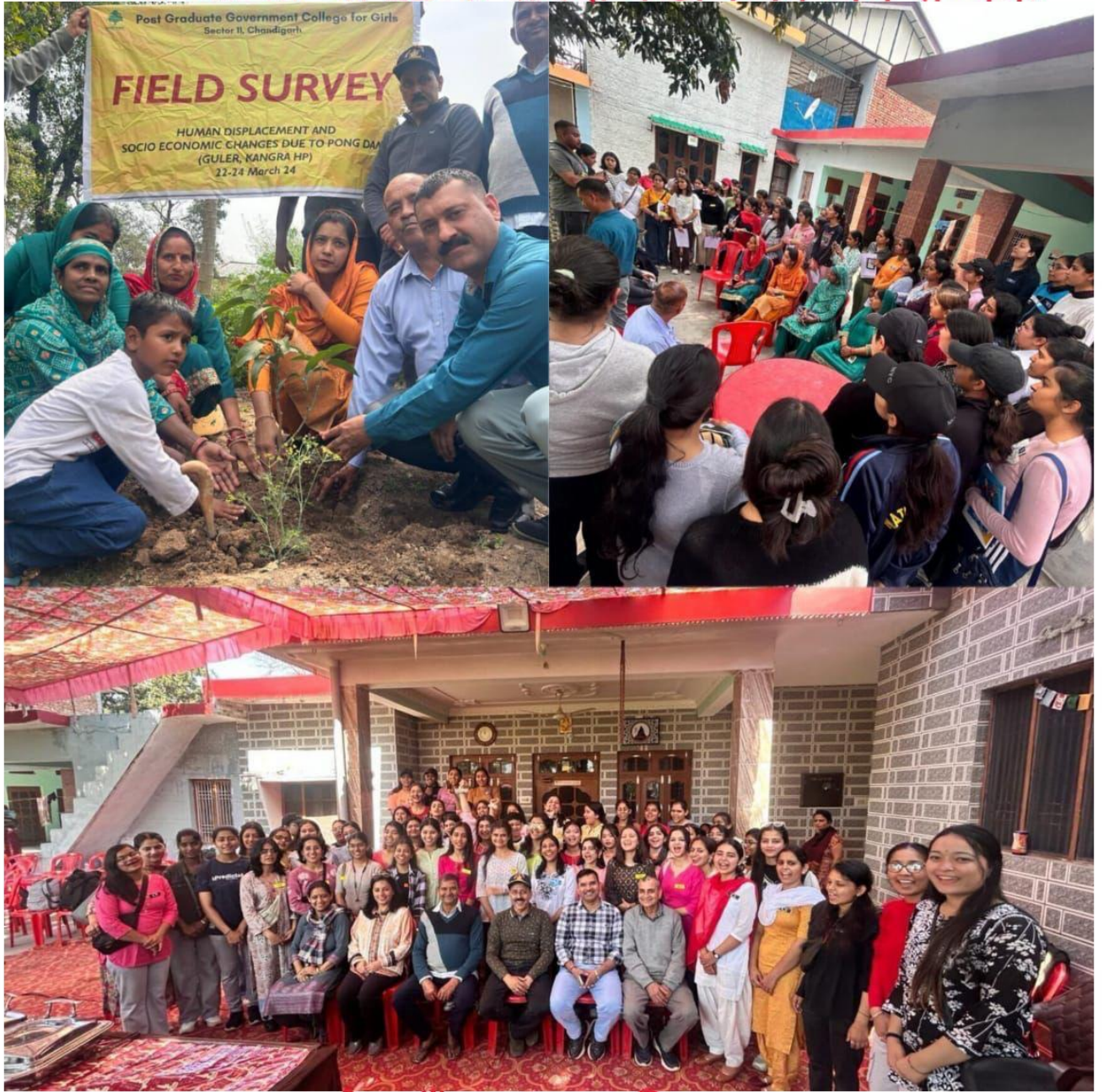
गुलेर गाँव, कांगड़ा, हिमाचल